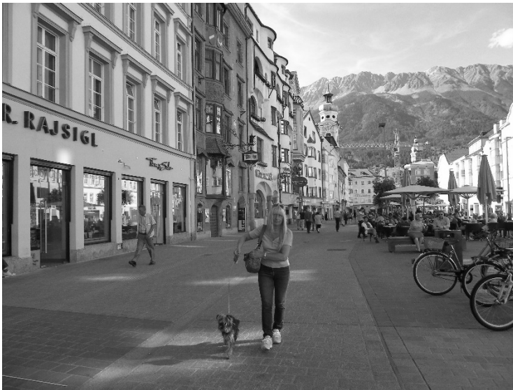
A passeggio per Innsbruck