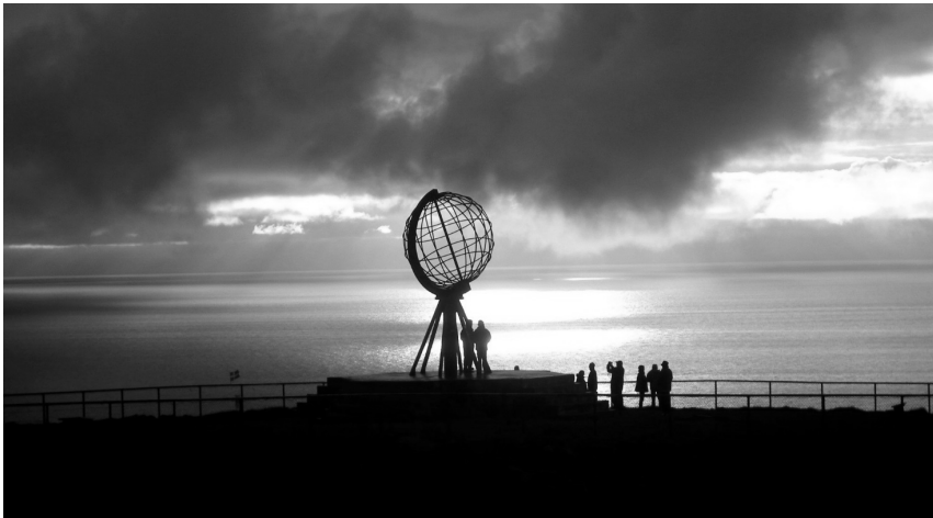
Nella foto: il sole a mezzanotte a Capo Nord

Nord kapp: Latitudine N° 71° 10' 86" Longitudine E° 25° 46' 43"