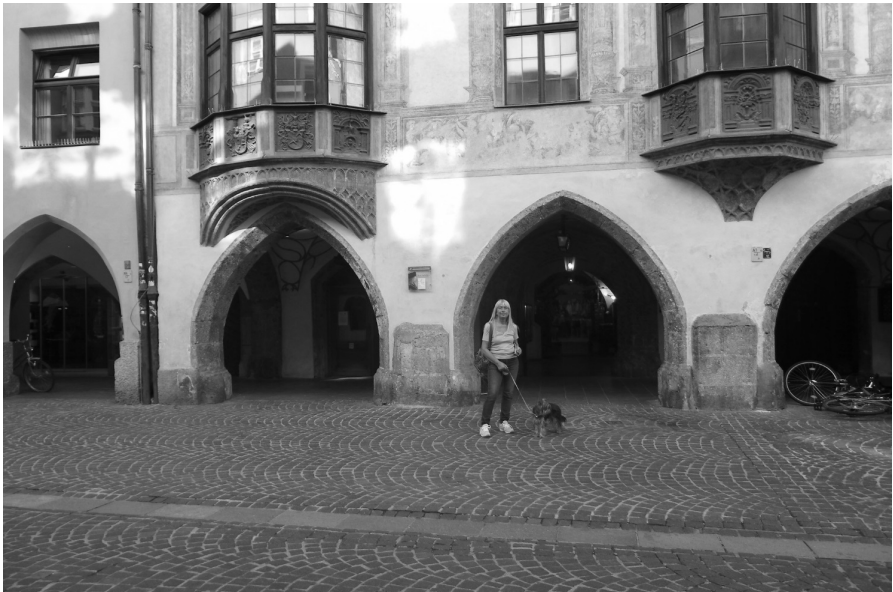
Innsbruck centro storico

Dopo i saluti di congedo ci dirigiamo verso Innsbruck, in Austria, che raggiungiamo verso le ore 13,00. Andiamo nel campeggio dove la direzione ci consegna una chiave con le istruzioni in austriaco, che io un ciò capito nulla, allora trovo un camper di torinesi e gli chiedo spiegazioni, ma anche loro non hanno capito niente così solo nella tarda sera scopriamo che sono le chiavi dei servizi e docce. Dopo pranzo andiamo in città con l'autobus, naturalmente senza biglietto perché ci avevano fatto capire che si poteva fare sull'autobus, infatti vicino all'autista c'era una macchinetta che prendeva gli euro e io infilo un euro e spingo il bottone, ma invece del biglietto mi sono preso una sfilza di ingiurie incomprensibili dall'autista tedesca, donna... che meno male aveva da guidare altrimenti chissà che avrebbe fatto, allora mi sono messo a sedere zitto in un angolino; io non ho capito niente, però abbiamo girato in autobus senza mai spendere un centesimo, così imparano. La città è molto bella e particolare, merita veramente una visita. Rientriamo in tarda sera con il solito autobus (gratis). Cena nel camper; km percorsi 138. Tempo bello e temperatura fresca.